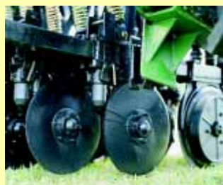
DISCOS DE CORTE