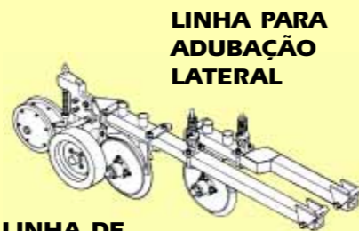
LINHA PARA ADUBAÇÃO LATERAL