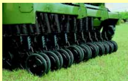
RODA COMPACTADORA EM "V"