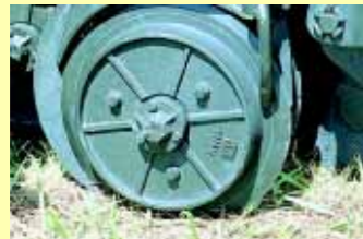
FRISOS LIMITADORES DE PROFUNDIDADE Ø 310 ou 330 mm.