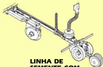
LINHA DE SEMENTE COM USG - Unidade de Semente Graúda