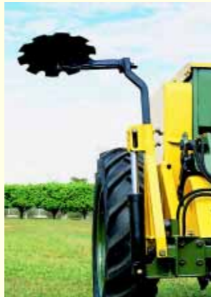
Marcadores de Linhas. (Opcional)