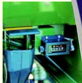
Contador de Hectares. (Opcional)