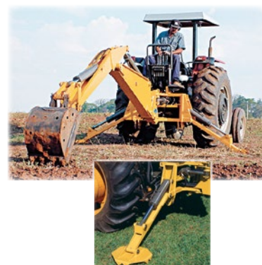
Caçamba Trapezoidal (Para Limpeza de Canais)