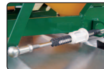
Regulador de dosagem de fluxo.