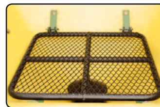
Grade de proteção com defletor regulável.