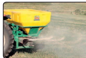
Largura de trabalho.