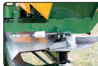
Disco lançador em aço inox.