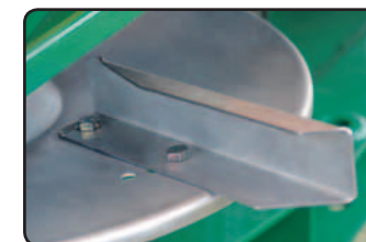
Pás de ângulo variável.