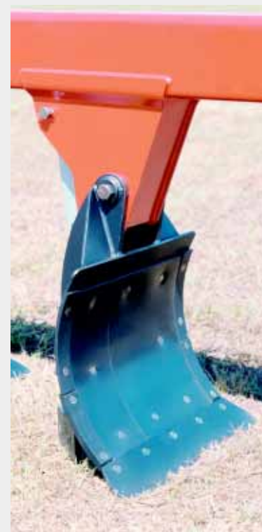
Revestimento com Placa de Polietileno.

* A potência deve ser observada em função da profundidade, tipo de solo e velocidade de trabalho.