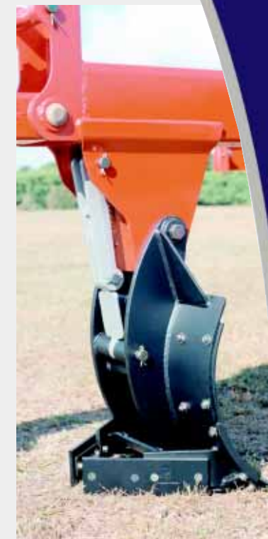
Desarme Automático das Aivecas.