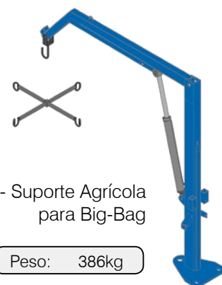
SAB - Suporte Agrícola para Big-Bag

O sistema BT (Bomba do Trator) utiliza a tomada de pressão externa do próprio trator.