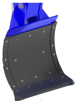
Bico da Aiveca Plano

Ponteiras: Disponibilizamos dois modelos de ponteiras, sendo estas: bico de aveica plano, que possibilita uma aeração até 40 cm de profundidade e bico de aveica côncavo, que possibilita uma aeração até 50 cm de profundidade.