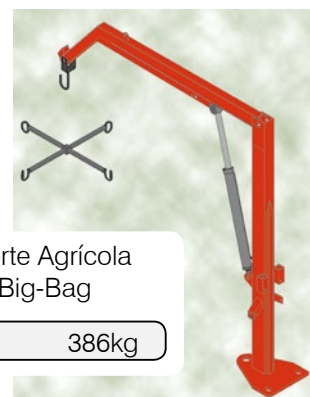
SAB - Suporte Agrícola para Big-Bag