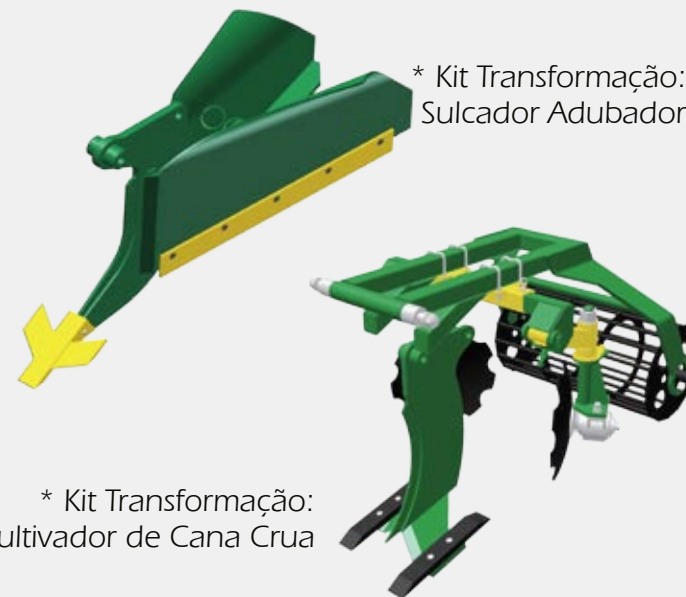
* Kit Transformação: Sulcador Adubador