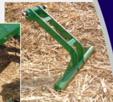
* Plainador Traseiro